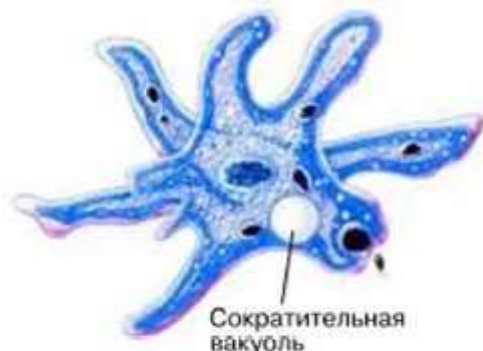
Рис. 79. Выделение у амёбы

У животных в процессе обмена веществ также образуются продукты жизнедеятельности. Поэтому каждое животное стремится сохранять нужные вещества и удалять вещества, которые ему не нужны, а иногда и опасны для него. Животные по-разному избавляются от продуктов обмена. Например, амёба от излишков воды избавляется с помощью сократительной вакуоли (рис. 79), которая, периодически сокращаясь, выталкивает наружу находящуюся в ней жидкость. Всей поверхностью тела удаляются ненужные вещества у гидр, медуз.