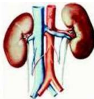
Рис. 80. Почки млекопитающих

У большинства многоклеточных животных функцию выделения выполняют специальные органы. Так, у дождевого червя есть каналы — нефридии (от греч. нефрос — почка). У насекомых функцию выделения выполняют трубчатые выросты кишечника. У рыб продукты обмена удаляются через жабры и почки, которые являются основным органом выделения у позвоночных животных (рис. 80). У птиц и млекопитающих в процессе удаления ненужных веществ участвуют также лёгкие, кишечник, потовые железы.